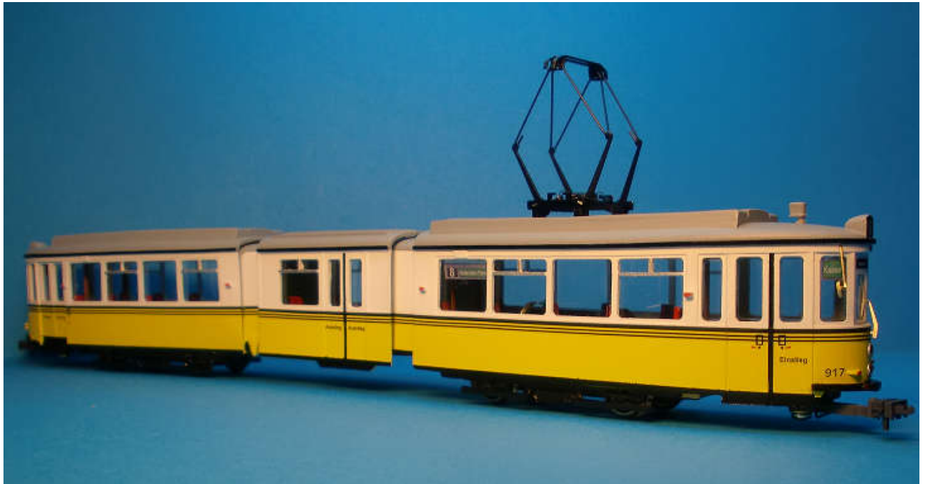
Abbildung zeigt Handmuster

Die überarbeiteten Modelle erhalten neue Fahrgestelle und sind damit, durch weniger Bauteile, einfacher zu montieren. Traditionell bleiben die Trennwände aus Messingblech erhalten. Damit kann der Wagenkasten mit den Bodenplatten verschraubt werden. Rammschutz, UKW-Antenne, Aussenspiegel, Bremsleuchten und Kupplungsdeichsel werden aus Messingguss hergestellt. Die Modelle sind mit einem Gleichstromantrieb/Schwungmasse ausgerüstet. Geätzte Scheibenwischer und klare Scheinwerfer gehören ebenfalls zum Lieferumfang der Modelle. Ebenfalls werden neue Wagennummern verfügbar sein. Auch die Gehäuseteile haben wir leicht überarbeitet, damit die Montage der Zurüstteile vereinfacht wird. Serienmäßig sind die Fahrzeuge mit Scharfenbergkupplung ausgerüstet. Optional steht das Zusatzpaket 5273 mit einem 2ten Antrieb und Dachstromabnehmer mit einem günstigen Preis zur Auswahl. Es werden die Wagennummern 911, 924 und 925 verfügbar sein. Die Auslieferung der Modelle erfolgt ab Anfang November 2020.