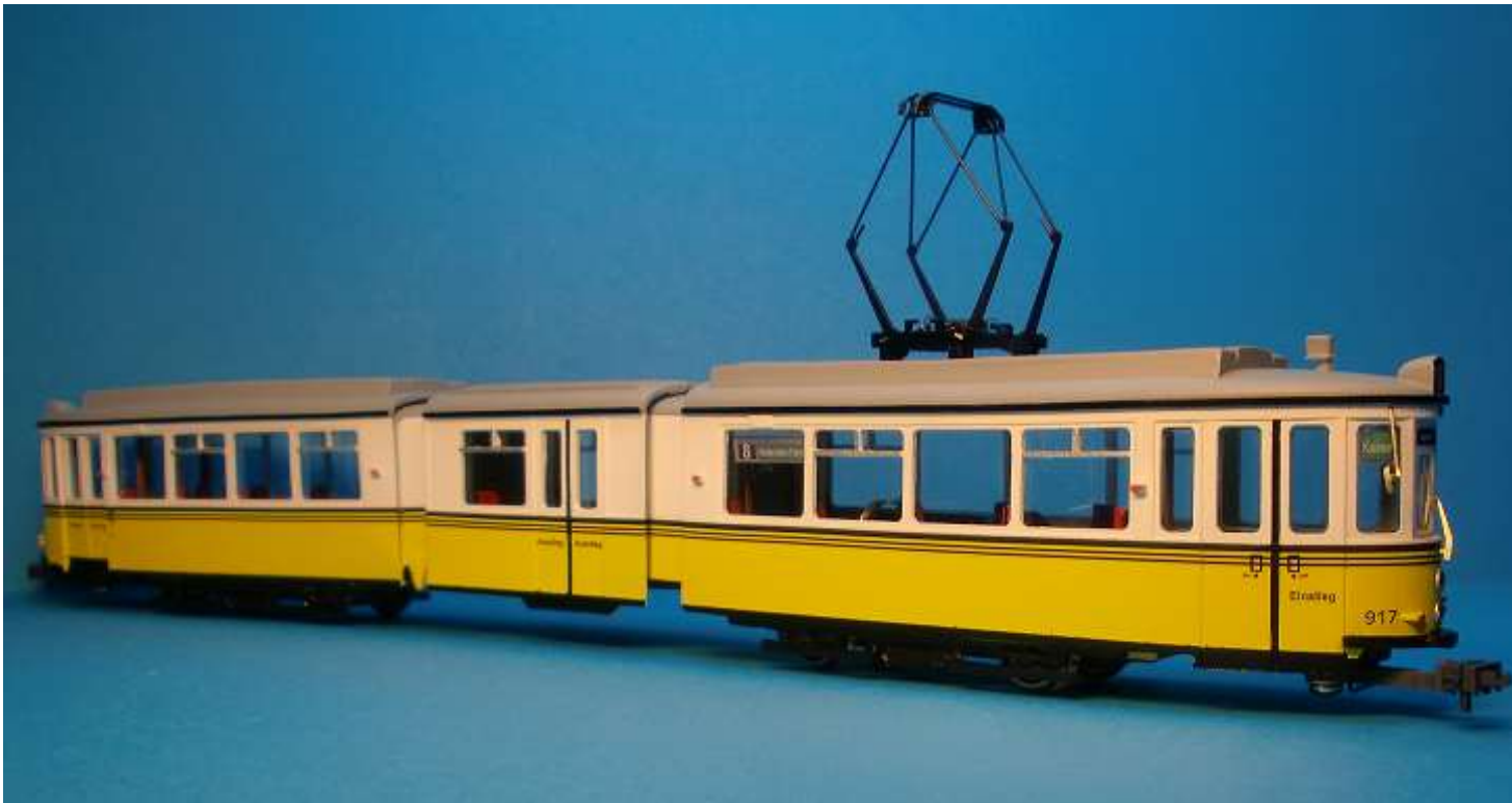
Abbildung zeigt Handmuster

Die 2020 überarbeiteten Modelle haben neue Fahrgestelle erhalten und sind damit, durch weniger Bauteile, einfacher zu montieren. Traditionell bleiben die Innentrennwände aus Messingblech erhalten. Damit kann der Wagenkasten mit den Bodenplatten verschraubt werden. Rammschutz, UKW-Antenne, Aussenspiegel, Bremsleuchten und Kupplungsdeichsel werden aus Messingguss hergestellt. Die Modelle sind mit einem Gleichstromantrieb/Schwungmasse ausgerüstet. Geätzte Scheibenwischer und klare Scheinwerfer gehören ebenfalls zum Lieferumfang der Modelle. Ebenfalls werden neue Wagennummern verfügbar sein. Auch die Gehäuseteile haben wir leicht überarbeitet, damit die Montage der Zurüstteile vereinfacht wird. Serienmäßig sind die Fahrzeuge mit Scharfenbergkupplung ausgerüstet. Optional können die Modelle mit einem zweiten Antrieb und Dachstromabnehmer geliefert werden. Der Beschriftungssatz enthält die Wagennummern 901, 911, 924, 925, 935 und die des ATW 2041.