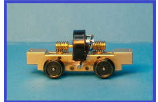
Abbildung zeigt Handmuster des Antriebs.